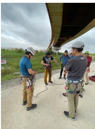
4. コンティニュアスのロープセット方法