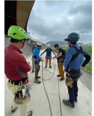
6. チェストコイルの巻き方