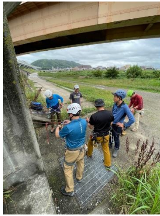
14. 懸垂下降のセットの練習