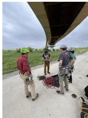
2. コンティニュアスのロープセット