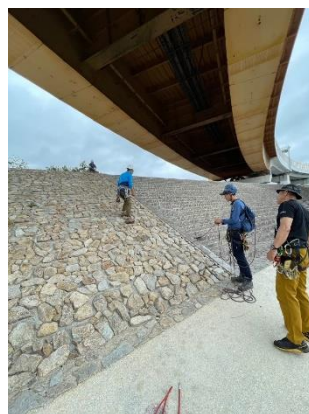
8. 同行者の確保の方法