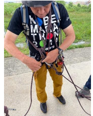
3. チェストコイルのセットの方法