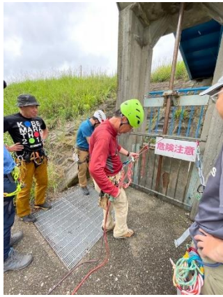
13. 懸垂下降のセットの練習