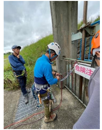
15. ブリッジプルージックの練習