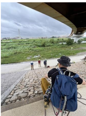
7. 同行者の確保の方法