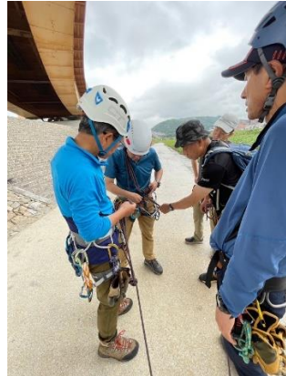
5. コンティニュアスのロープセット